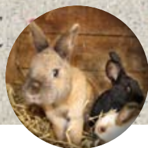
Die Häschen sind so süß.