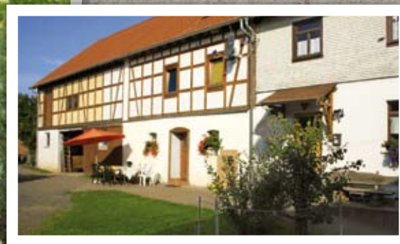
Hier haben wir gewohnt.